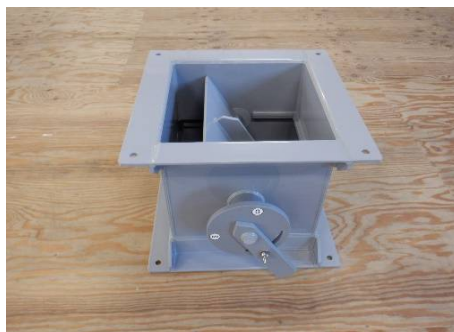
角型・単翼・レバー式