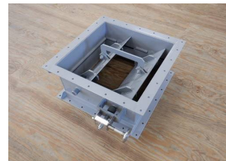
角型・複翼・ウォームギア式