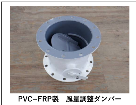
PVC+FRP製 風量調整ダンパー