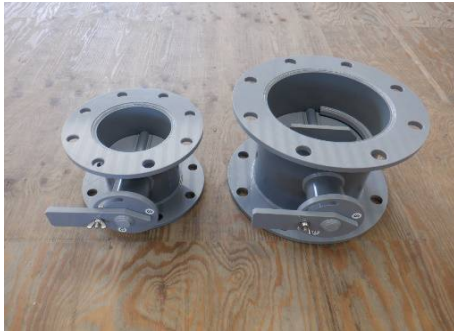
丸型・単翼・レバー式